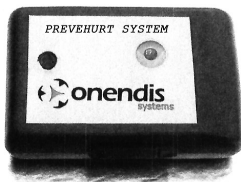
DISPOSITIVO DE POSICIONAMIENTO PREVEHURT SYSTEM Y ONENDIS SYSTEMS

ejemplo, el nivel de batería; Monitorización en tiempo real; Batería de alta duración, de uno a cinco años, o que el sistema no alcanza los cuarenta y tres gramos de peso y está provisto de dos ranuras que facilitan su sujeción a un cinturón.