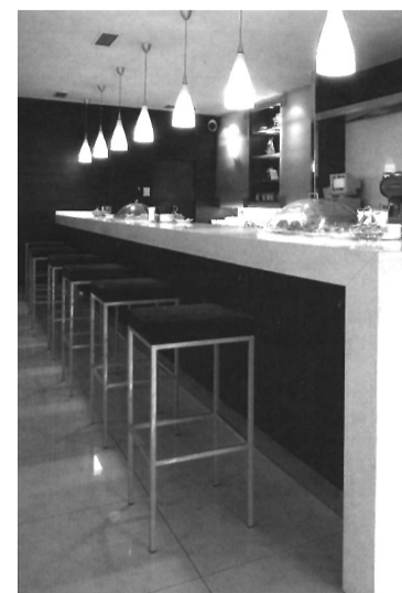
EL OBRADOR: SILESTONE MONTBLANC

Indumar realiza una gestión integral mediante la medición, fabricación e instalación en obra de todos sus materiales, siempre adaptándose a las necesidades y exigencias de sus clientes. Esta es, sin duda, una de sus señas de identidad. En este punto cabría añadir que la firma navarra es una referencia obligada en campos como el medio ambiente, la calidad -ha implantado un sistema basado en la norma UNE-EN-ISO 9001:2000-